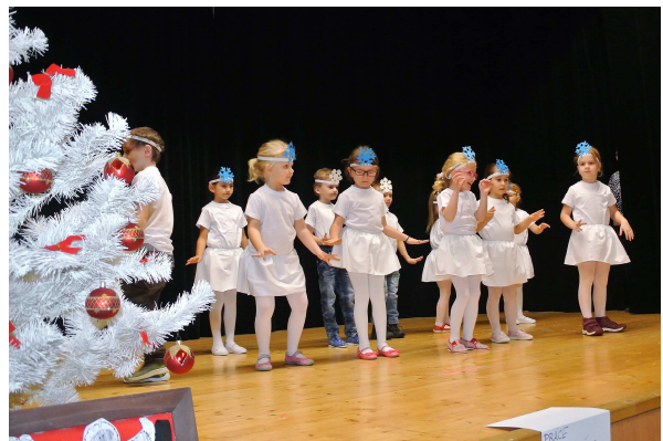
Vánoční jarmark a vystoupení dětí z MŠ