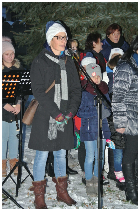
Rozsvícení vánočního stromu v r. 2018