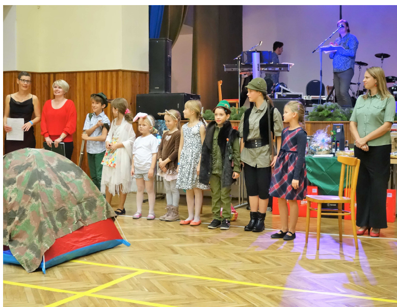
Scénka s mysliveckou tematikou pro Hubertskou zábavu