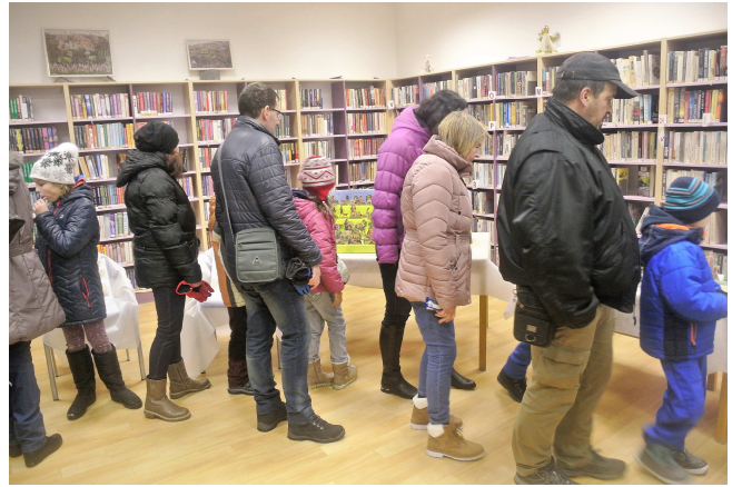
Výstava betlémů v místní knihovně