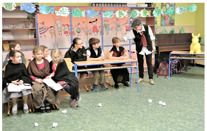
Malá fotoreportáž z oslavy 180. výročí založení školy