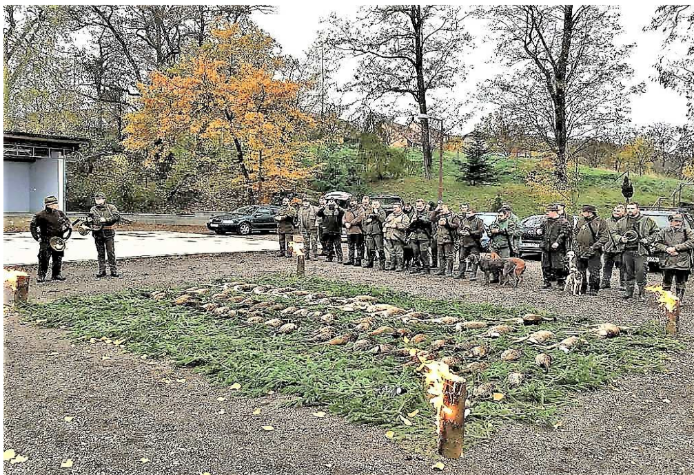
Výřad honu 3. 11. 2018