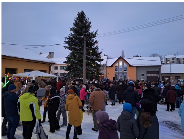
Rozsvícení vánočního stroměčku