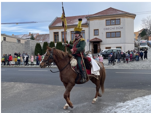
Pochod napoleonských vojsk