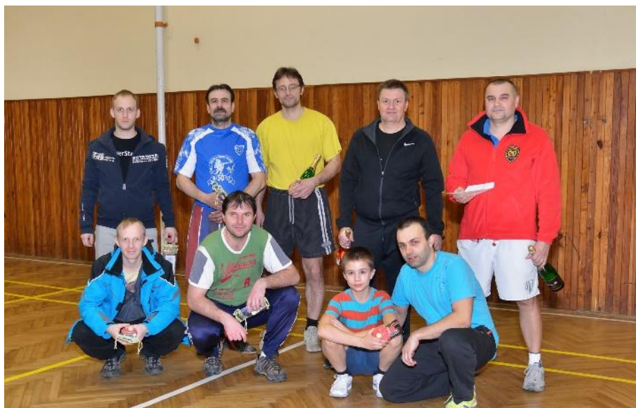
Vánoční turnaj 2015 v Orlovně

Jistě nemusím vyprávět, jak je těžké založit oddíl, a ještě těžší hrát pravidelně soutěž. Naše první kroky vedly do Orlovný, kde jsme na dvou stolech začali trénovat a později i hrát zápasy. Prvotní nadšení a trénink nám pomohl před