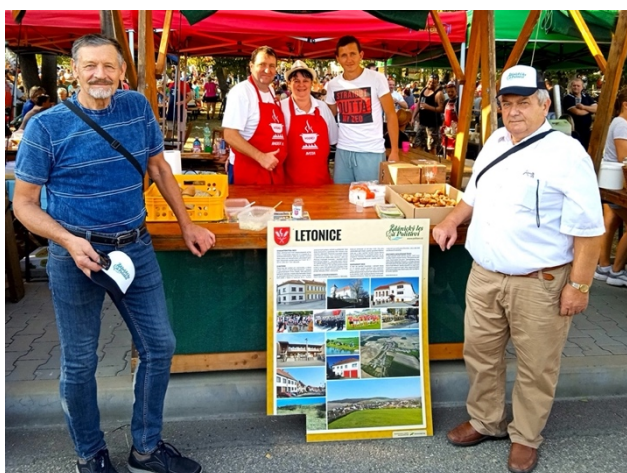
Vyhodnocení cykloakce ŽLAP