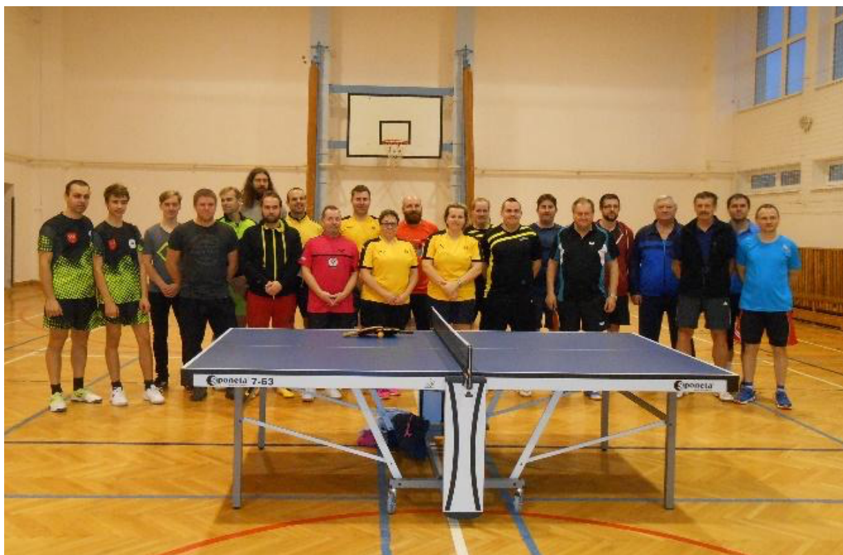
Vánoční turnaj 2018 ve školní tělocvičně