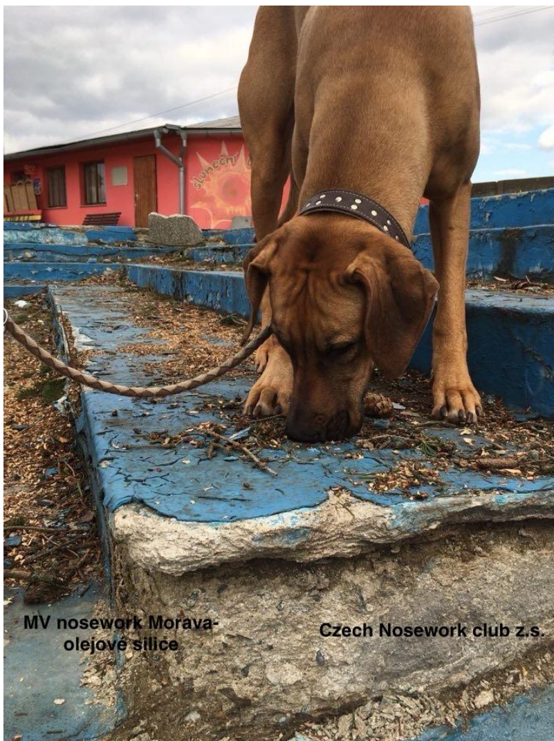
MV nosework Morava- olejové silice

Nosework zvyšuje sebevědomí u bázlivých psů, zvyšuje schopnost koncentrace – pes se naučí soustředit i v náročnějších prostředích. Nosework je také vhodný i pro psy reaktivní, starší i nemocné. Nosework dokonale psa zabaví a příjemně unaví.