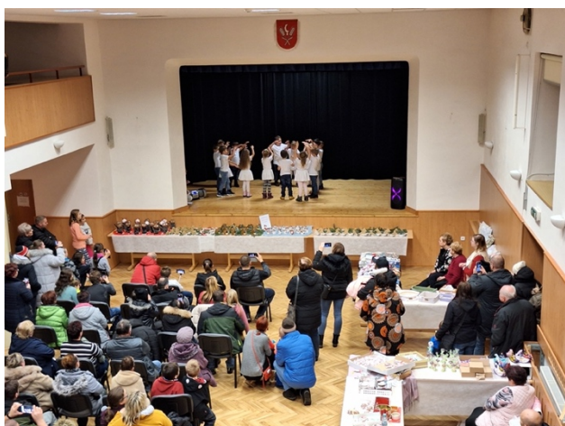
Vystoupení MŠ na vánočním jarmarku