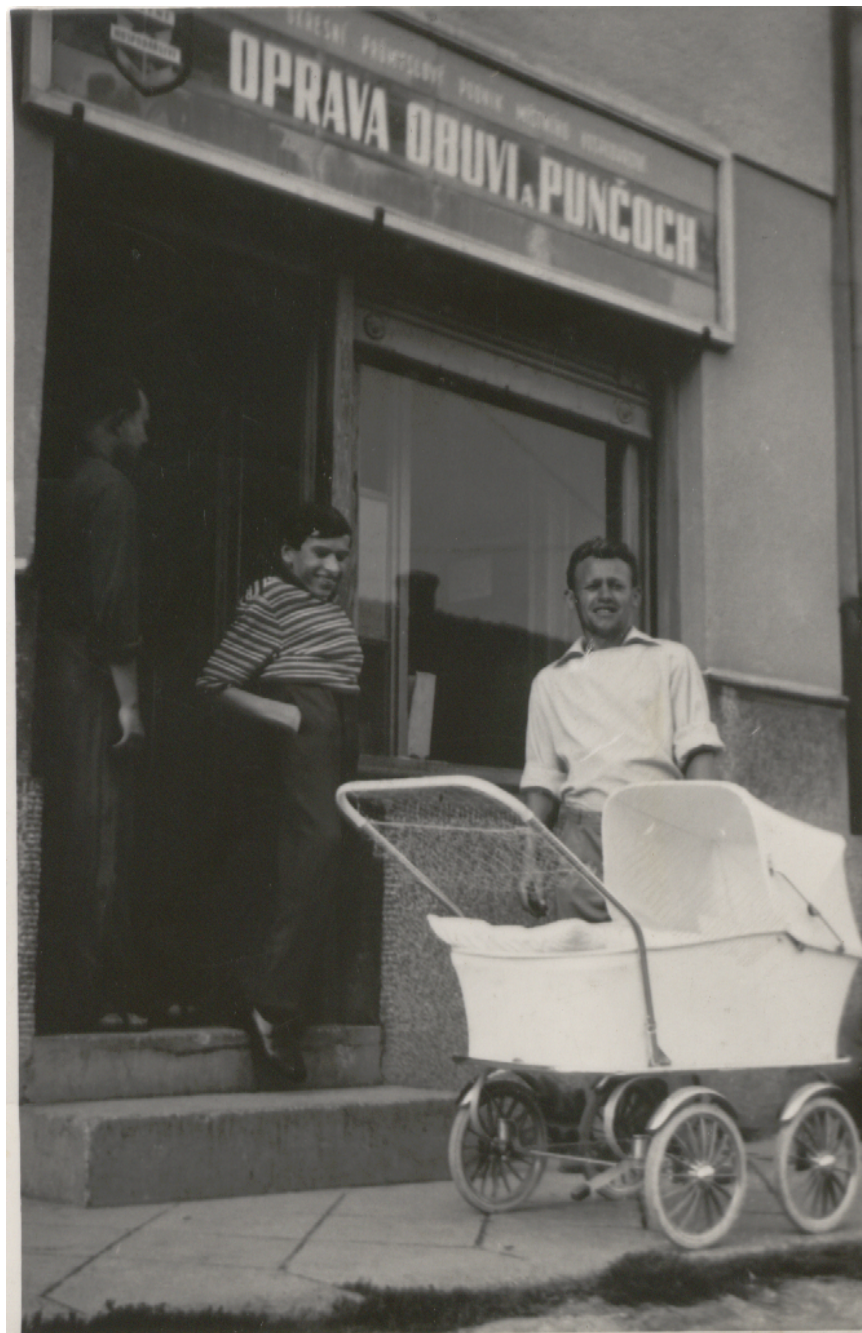
Opravna obuvi v Letonicích