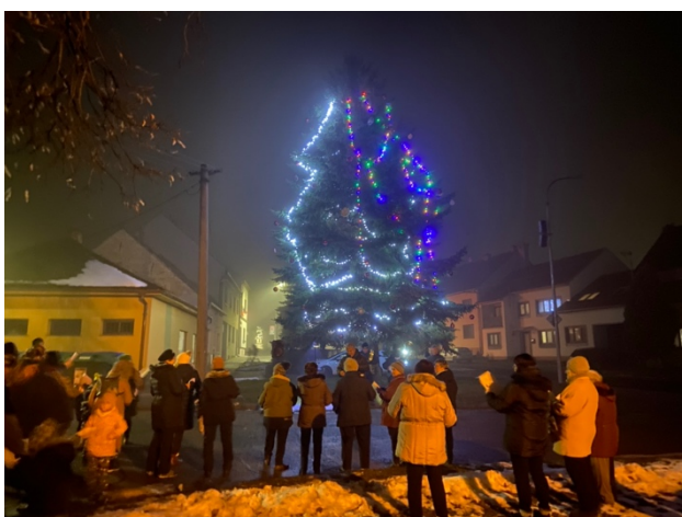
Česko zpívá koledy