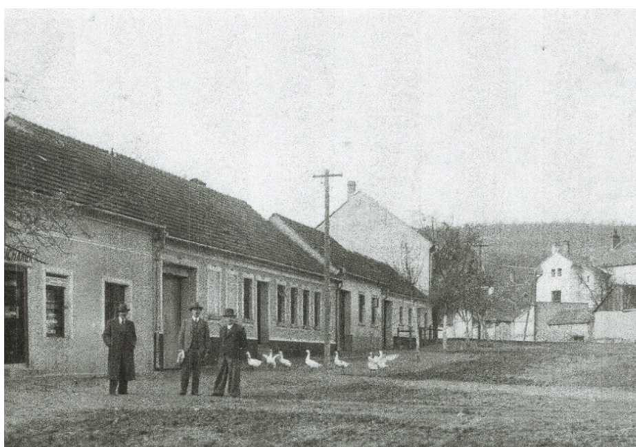
Obchod p. Suchánka