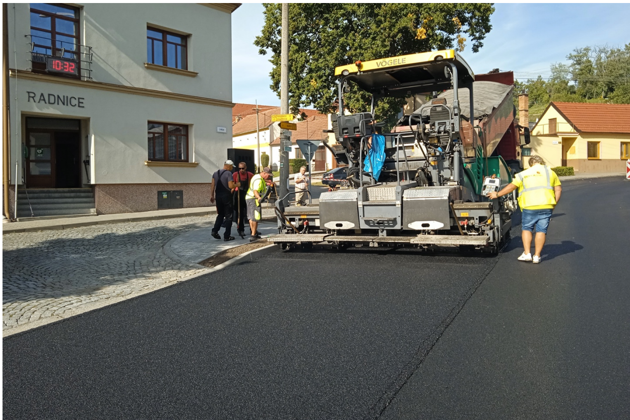
Oprava hlavní komunikace před OÚ