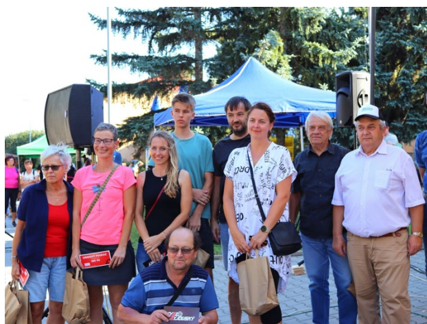
Vyhodnocení cykloakce ŽLAP