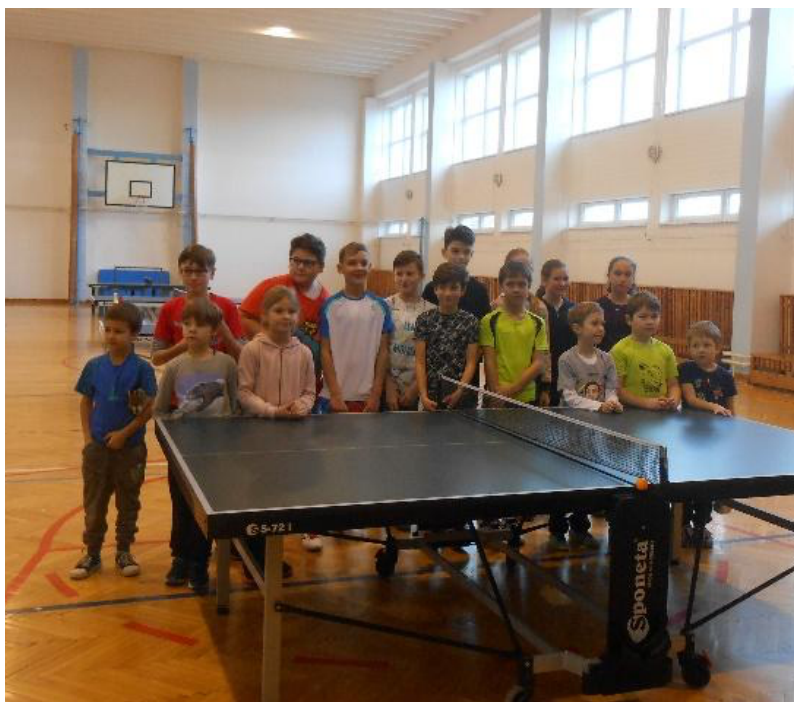
Vánoční turnaj 2018 ve školní tělocvičně

sezónou získat alespoň malou herní jistotu. Píše se rok 2016 a nám začíná první zápas v okresní soutěži 4: Letonice vs TJ Heršpice, byl to zápas plný nervozity, ale vítězství 17:1 nás uklidnilo. V téhle sezóně se nám podařilo postoupit do vyšší soutěže z druhého místa. V dalších letech jsme se přesunuli do školní tělocvičny, kde hrajeme do dnes. V roce 2020 nám sezónu předčasně ukončila