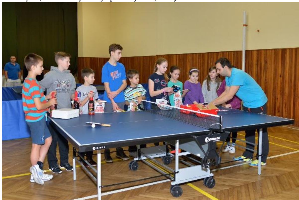
Vánoční turnaj 2015 v Orlovně