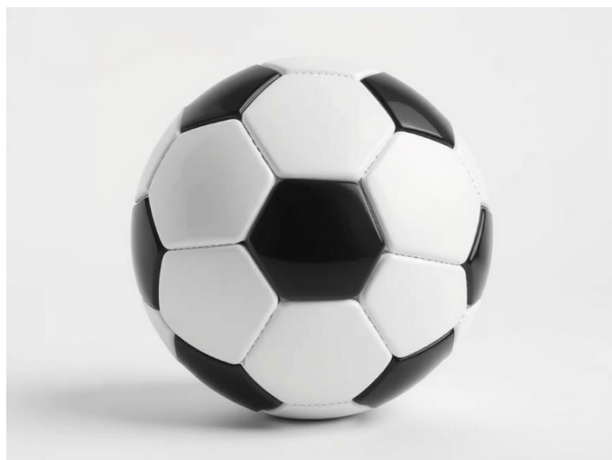
Ilustrační obrázek