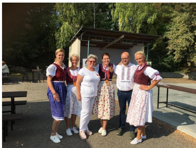
Soutěžící v ženské kategorii