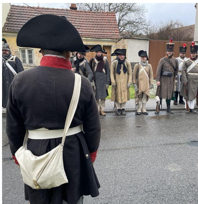
Vojáci při ranním nástupu a brífinku na poslední štaci