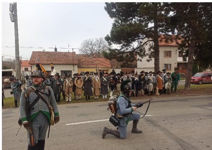
Ukázka střelby při ranním nástupu