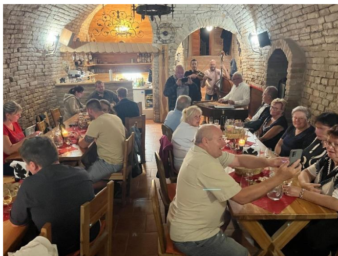
Návštěva vinného sklepa v Hustopečích