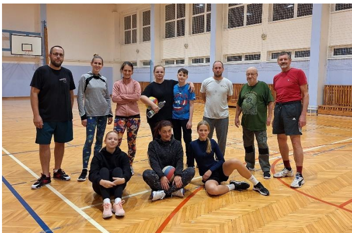
Volejbalový oddíl – dospělý