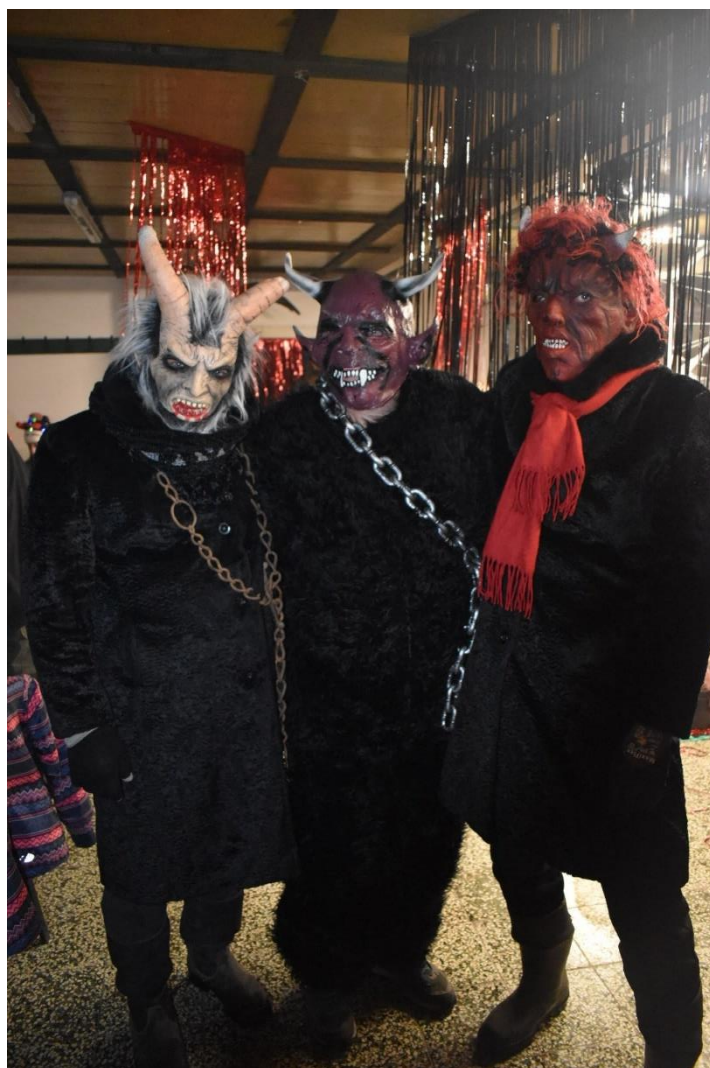
Pochod čertů v Letonicích