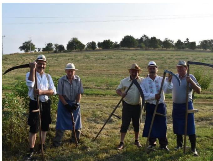
Soutěžící v mužské kategorii