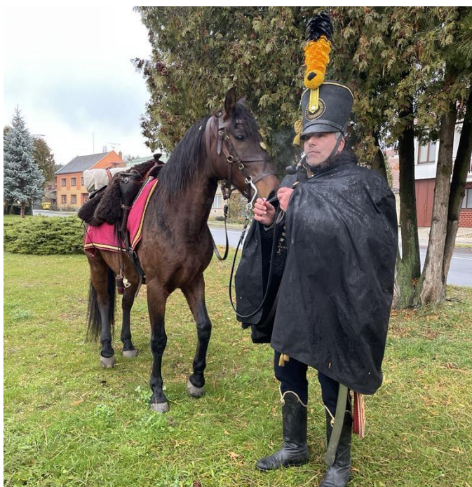
Vojáci každoročně prochází Letonicemi na cestě z Olomouce do Slavkova u Brna