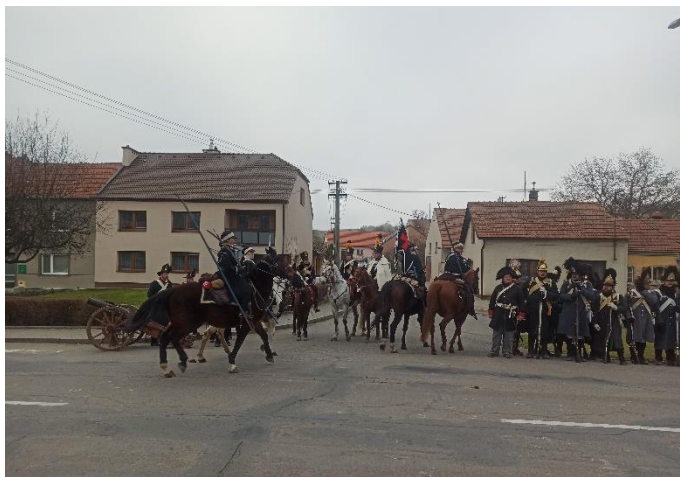
Ukázka vojsk napoleonských válek v Letonicích

Z historických materiálů zpracoval, Ing. Jiří Skokan