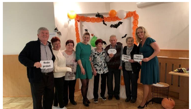
Dobrá nálada panovala po celé odpoledne