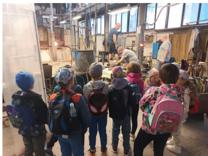
Děti viděly ruční výrobu foukaného skla