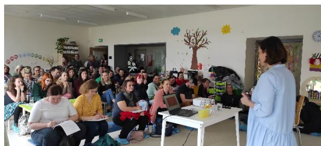
(Zdroj: Mgr. Eva Kreizlová)