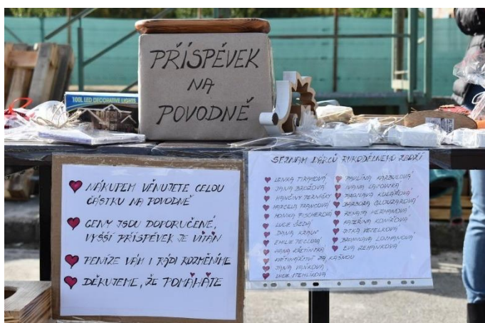
Výtěžek z charitativního jarmarku činil 75 000 Kč (Zdroj: Lucie Stehlíková)