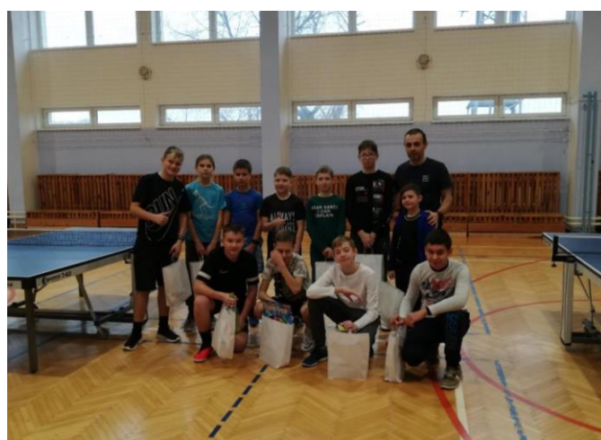
Vánoční turnaj ve stolním tenise 2023 - děti