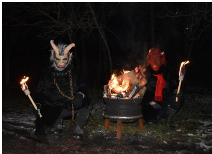
Pochod čertů v Letonicích

V sobotu 7.12.2024 se v Letonicích uskutečnil tradiční pochod čertů a čertic. Po společné procházce vesnicí, čerty přivítal ohňostroj v pekelném areálu MS Letonice, kde na všechny čekalo občerstvení a pro děti balíček sladkostí. Akce měla i tentokrát velkou účast a nádhernou atmosféru dokonalého pekla. Nechyběl zde ani pekelný kovář s ukázkou svého řemesla a dobroty z udirny. Všem patří velké poděkování a MS Letonice zvláště za vytvoření pekelného zázemí a zajištění skvělého občerstvení.