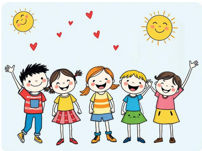
Ilustrační obrázek

Listopad přinesl spoustu nových zážitků. Vystoupili jsme s pásmem pro seniory v kulturním domě a potěšili je písničkami i básničkami. Také nás navštívilo maňáskové divadlo, které dětem přiblížilo další krásné příběhy.