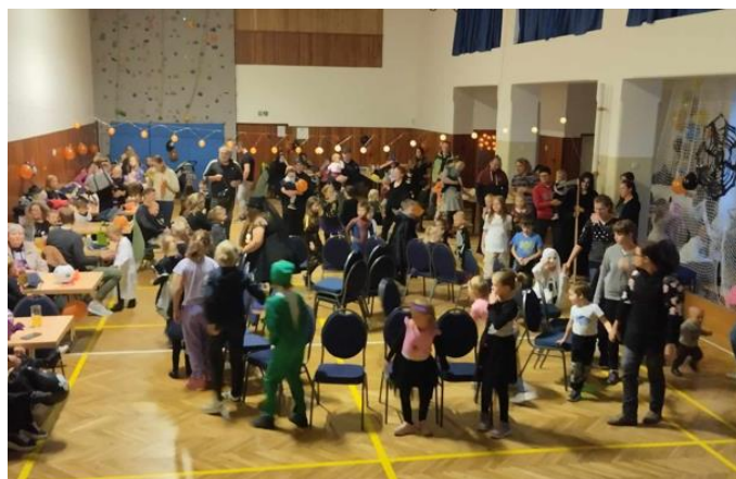
Maškarní ples