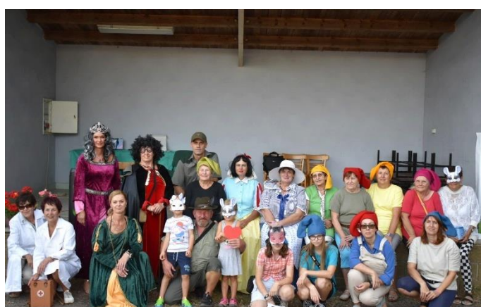
Ukončení prázdnin se Sněhurkou