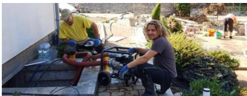
Poskytování pomoci v obcích zasažených povodněmi