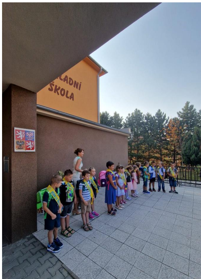
První školní den pro nové prvňáčky

Během září jsme zaseli na školní zahradě do vyvýšených záhonů různé bylinky a díky