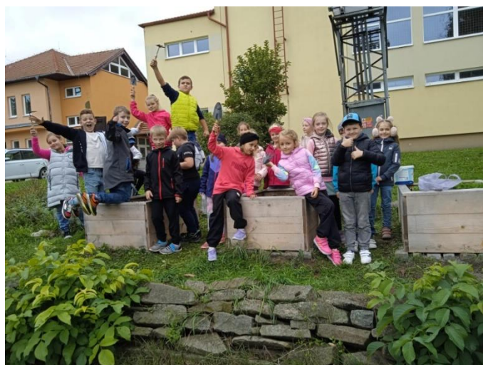
Práce ve školní zahradce

Podzimní exkurze proběhla 1.10. ve sklárně Květná. Autobus nás zavezl až na hranici se Slovenskem. Květná je nejdéle fungující sklárna v ČR. Děti mohly na vlastní kůži zažít, jak vypadá ruční výroba foukaného skla a projít celou sklárnu. Velké teplo, hluk pecí a ruční foukání nebo malování skla všechny uchvátilo. Žáci žasli nad tvrdou prací sklářů, a hlavně nad krásou skleněných výrobků. Kromě zážitku si