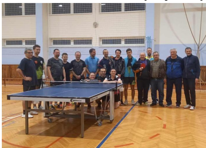
Vánoční turnaj ve stolním tenise 2023 - dospělý