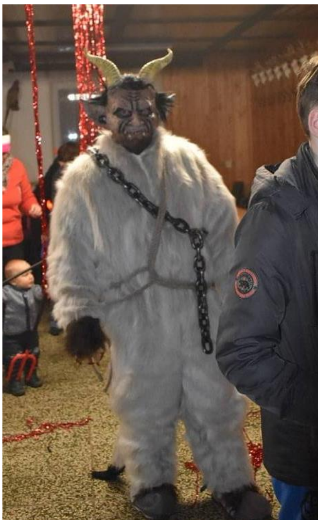
Pochod čertů v Letonicích