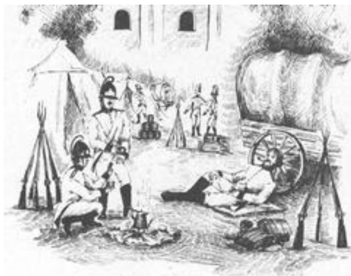
Kresba ležení napoleonských vojsk

Ve farní kronice existuje zápis, dle kterého císař Napoleon s pěti důstojníky dva dny po bitvě, tj. 4.prosince, přenocoval na faře v Dražovicích. Toto však není historicky potvrzeno a pravděpodobně nešlo o Napoleona, ale nějakého vysokého důstojníka jeho sboru. Zde je rovněž zmínka o ztrátě kalicha se stříbrným a měděným podstavcem váhy 18 uncí, který náležel