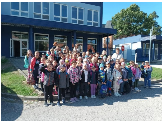
Exkurze ve sklárně květná

kolektiv zaměstnanců základní školy Letonice