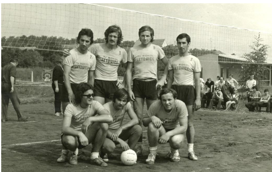
Mužský volejbalový tým z roku 1975