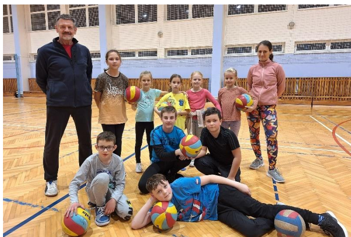
Volejbalový oddíl – děti