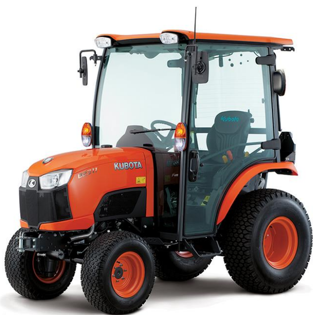
Nově pořízený traktor Kubota pro potřeby obce

vede vedle budovy zahrádkářů. Vozovka v ulici U Hřiště, od křižovatky s ulicí 1. máje, byla zpevněna a položen na ni nový živičný povrch. Na místním hřbitově došlo k předláždění stávajících chodníků a rozšíření o nové, vedoucí k urnovým hrobům. Spoluúčastí obce bylo vybudováno zastřešení terasy v mysliveckém areálu a zrekonstruováno hřiště s umělým povrchem v areálu TJ. V hájku byly postaveny nové oplocenky k zabránění okusu mladých porostů. Pro zlepšení bydlení v obecních bytech byl zateplen strop hasičské zbrojnice. V rámci rozšíření technického zázemí obce byl zakoupen vlek a čelní nakladač k malotraktoru a dva kontejnery na bioodpad. V rámci propagační kampaně bylo bez nákladů obce zřízeno „psí hřiště“ v ulici U Koupaliště. V bývalém areálu zemědělského družstva proběhla demolice čtyřřadého kravína, na jehož místě je plánována výstavba objektu „technických služeb“ a zázemí obce. Majetek obce byl rozšířen o nákup zemědělských pozemků a všechny stavební pozemky v ulici Horany byly prodány stavebníkům. Část pozemků v extravilánu byla propachtována za účelem vybudování společných zařízení a výsadby stromů. Do příštího roku byla odložena rekonstrukce kotelny základní školy, úprava svahu v ulici Bučovská, vybudování