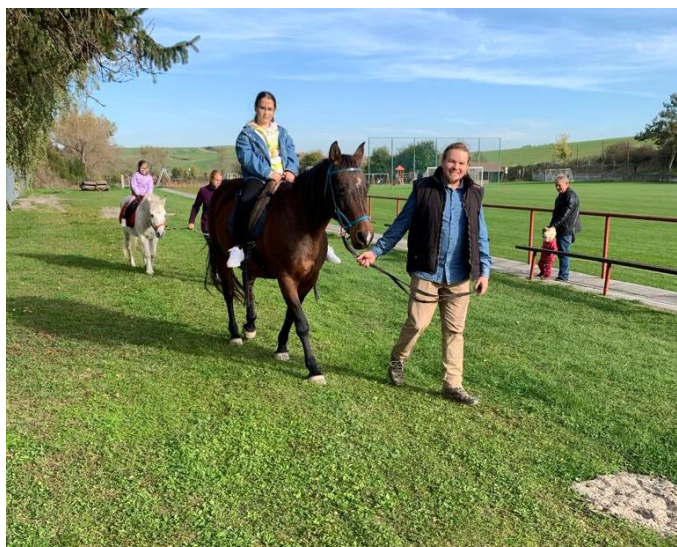
Projížďky na koních zajistila rodina Balážových