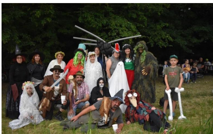
Zahájení prázdnin s názvem, Kdo se bojí nesmí do lesa