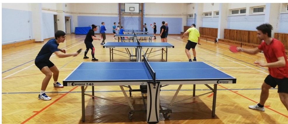
Trénink stolního tenisu v Letonicích