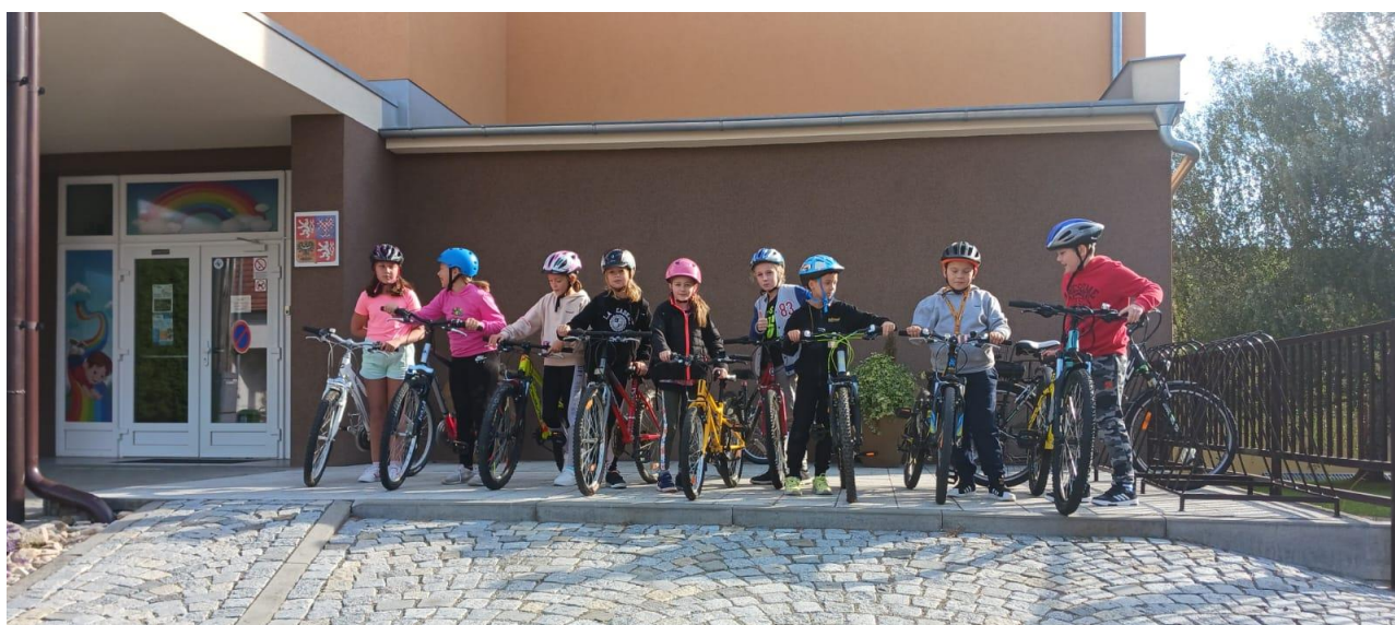
Výuka žáků na dopravním hřišti ve Vyškově