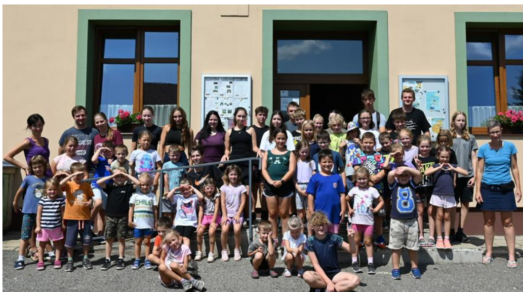
Účastníci příměstského tábora 2024