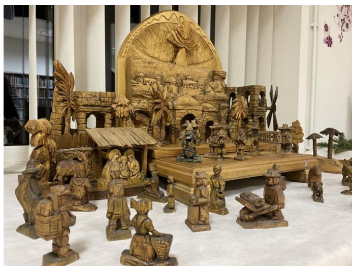
Jeden z mnoha vystavených betlémů

Děkuji všem, kteří zapůjčili na výstavu betlému své exponáty. Velké poděkování patří také těm, kteří se podíleli na její přípravě.