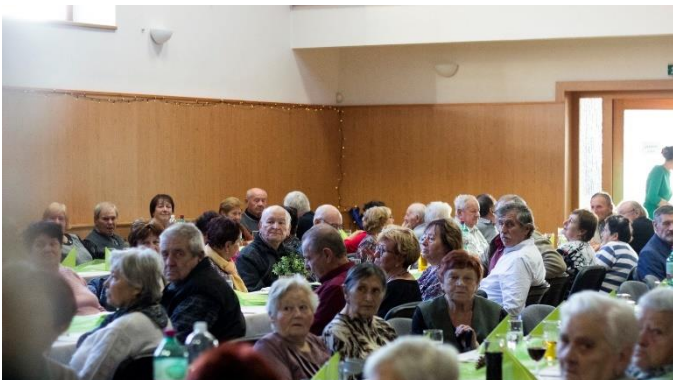
Přivítání a slovo úvodem od starosty obce